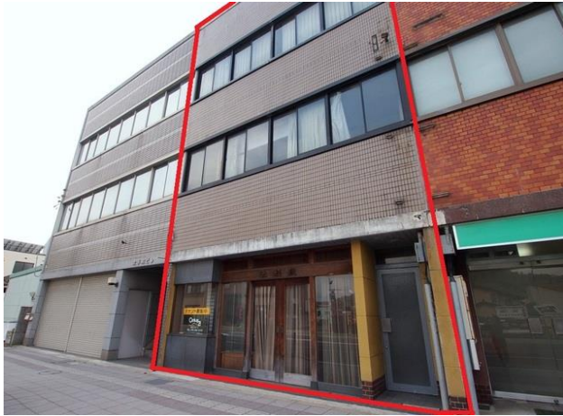
大手町戸建ビル（2・3階） 棟取図（予定）